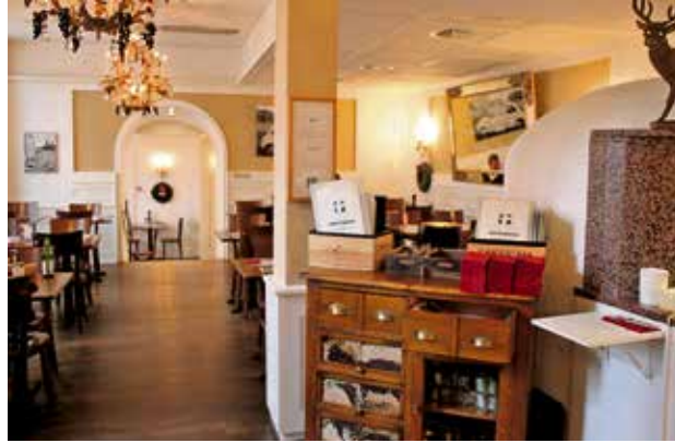
Das Weisse Kreuz in Luzern hat nun eine kinderfreie Zone.